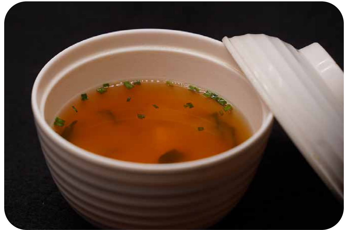
117 Zuppa di miso tofu e alghe wakame € 3.00 🌱