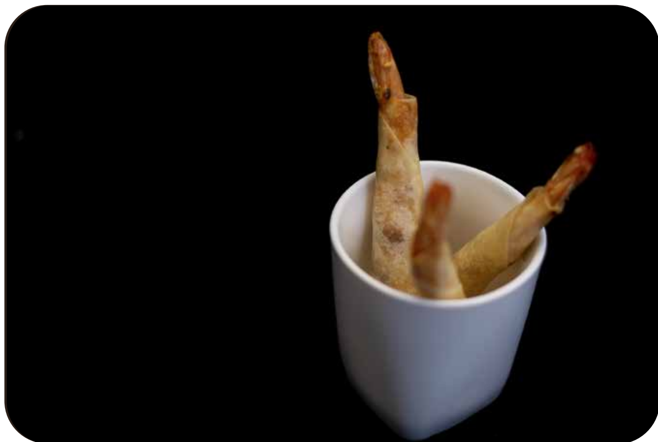
001 Ebi stick fritto di gambero* avvolto in spring pastry con sesamo € 7.00 🌾 🌿 🍷