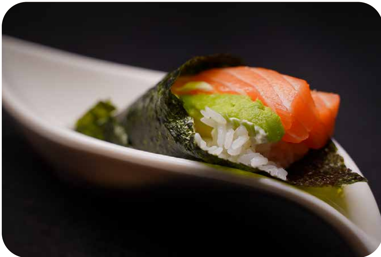
216 Cono sake salmone, avocado e philadelphia € 4.00 🍴 🥗 🥑