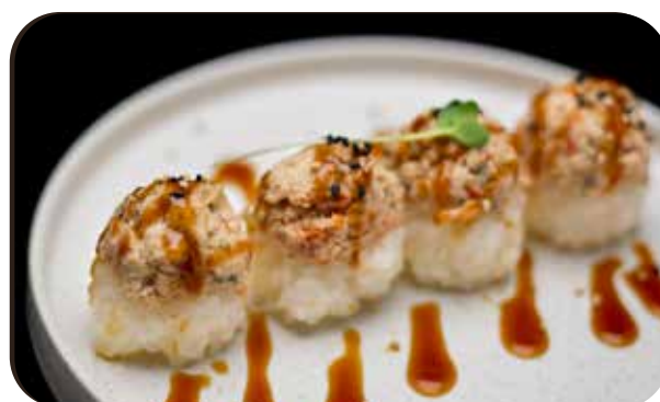
165 Tuna balls