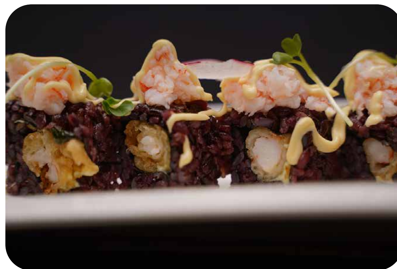
267 U.Noir ebiten [gambero* in tempura, maionese] cubetti di gambero*, erbette e spicy mayo € 10.00 🍷 🍷 🍱