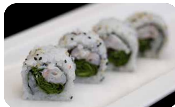
241 U.Ebi rolls [gambero* cotto, rucola, philadelphia] salsa € 8.00 🍷 🍷 🍱