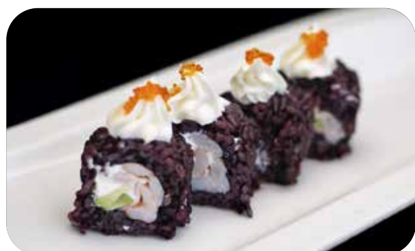
274 U.Noir ebi [gambero* cotto, avocado] philadelphia, tobiko e salsa € 9.00 🍣 🍷 🌿 🐟