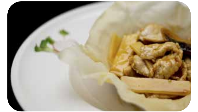
092 Butaniku in work carne* saltate con bambu e funghi € 7.00