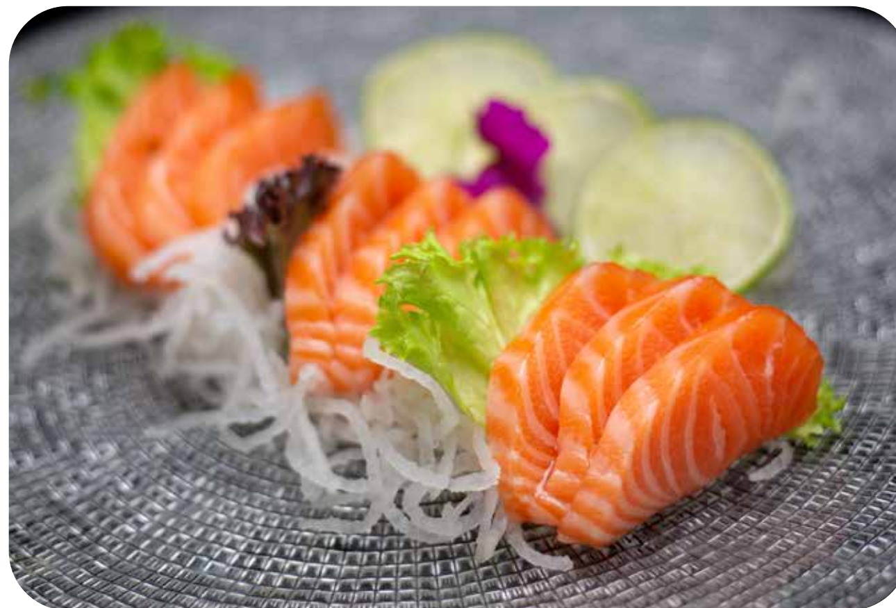
287 Sashimi salmone 5 fette di salmone € 10.00 🍣 🐟