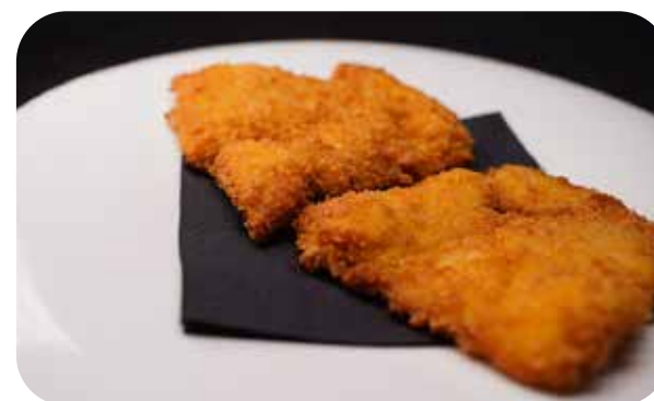
049 Tori no kara age pollo* fritto € 7.00 🌿