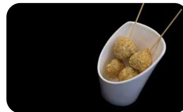
010 Puripuri ika polpetta di calamari* € 7.00 🍷