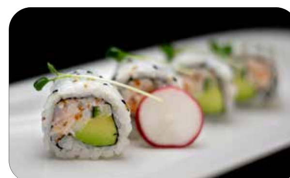
230 U. California [gambero* e surimi* di granchio tritato, tobiko, maionese, cetriolo, avocado] sesamo ed erbe € 8.00 🍴 🥗 🥑