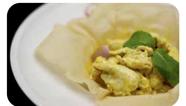
097 Pollo* al curry € 7.00