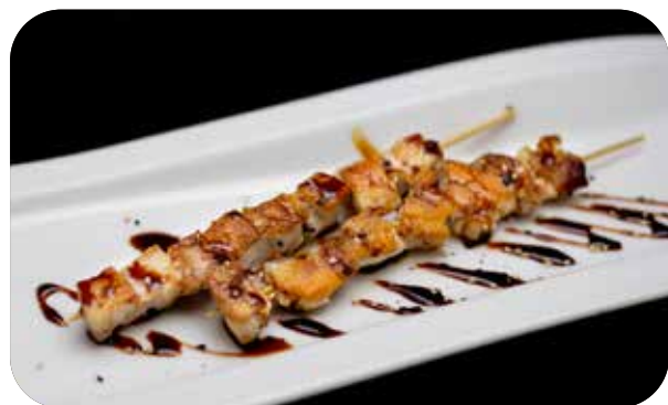
111 Yaki tori spiedini di pollo* alla griglia con salsa e sesamo € 7.00 🌱 🌿