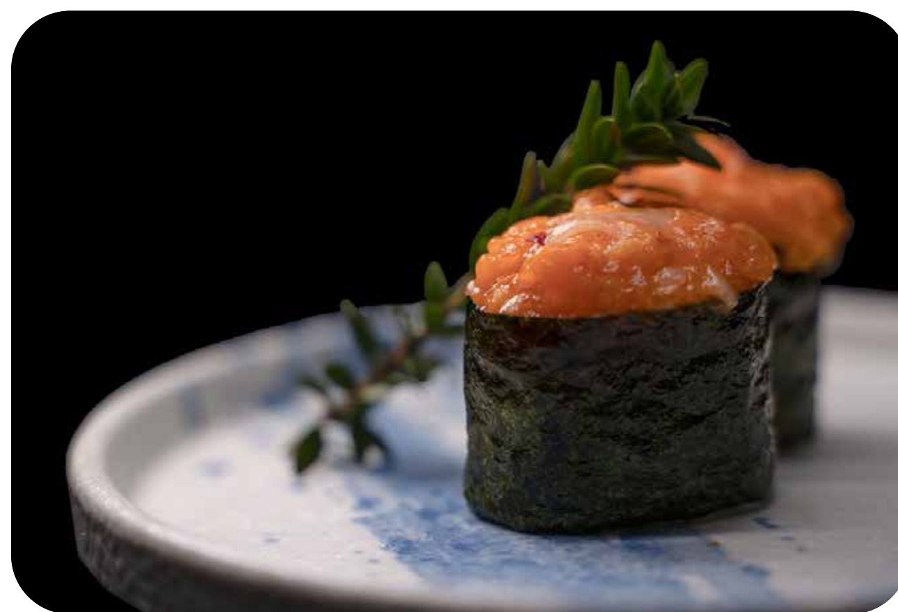
171 G.Spicy salmon

salmone tritato, cetriolo, tobiko, tabasco e alga all'esterno