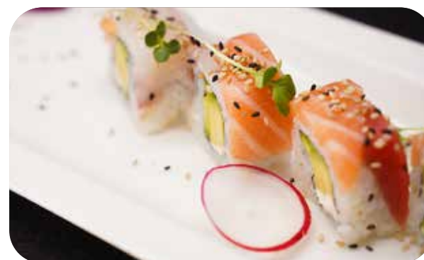
239 U.Rainbow rolls [avocado, philadelphia] pesce misto, erbette e sesamo € 10.00 🍷 🍷 🍱