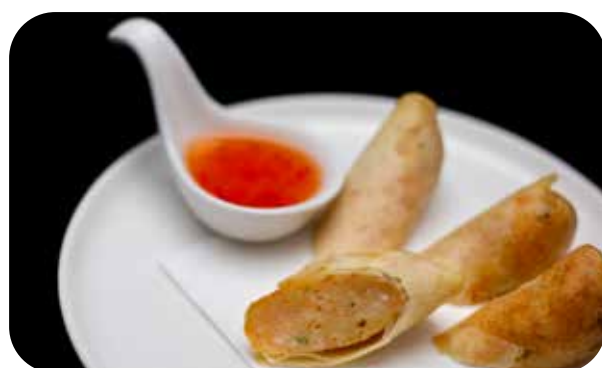
003 Harumaki involtino fritto ripieno di gamberi* € 6.00 🌾 🌿 🍷