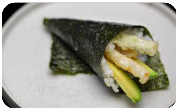
221 Cono vega stick di verdure e avocado € 4.00