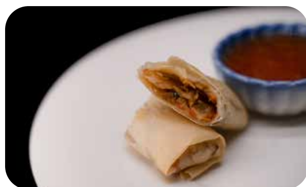
002 Yasai maki involtino fritto ripieno di verdure di stagione e black fungus € 5.00 🌾