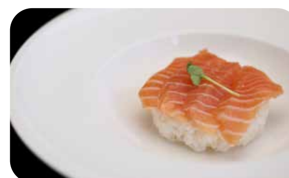
207 Chirashi salmone cubetti di salmone con riso € 9.00 🐟