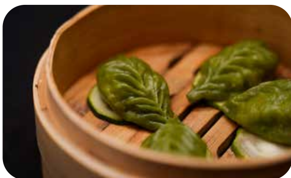
034 Yasai gyosa ravioli agli spinaci ripieni di verdure di stagione e black fungus € 4.50 🌿