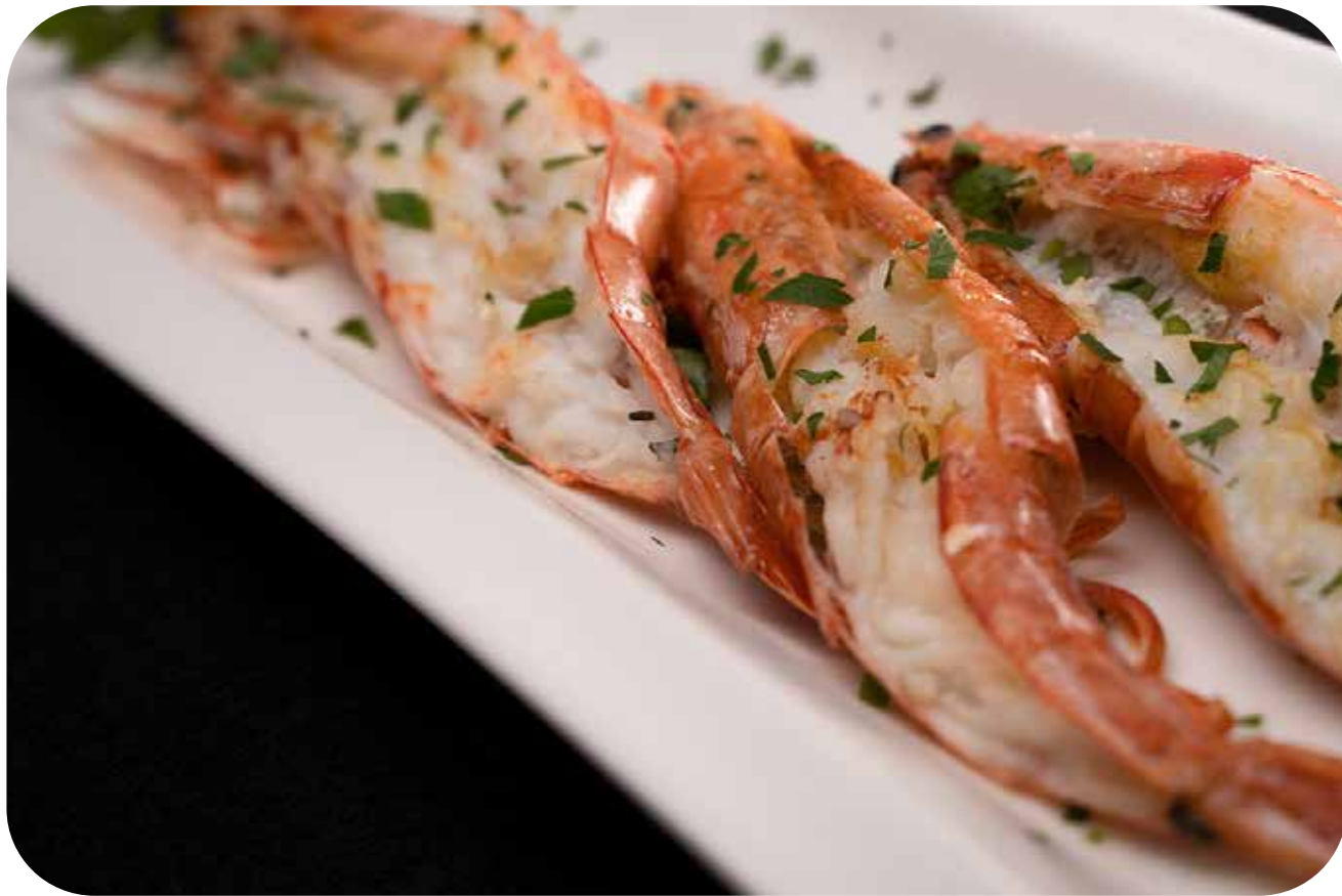
108 Ebi yaki (max 1 porzione/persona) gamberoni alla griglia € 10.00 🌱