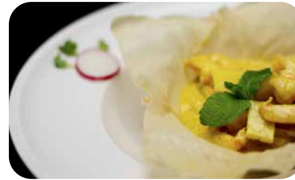
091 Gamberi* al curry € 7.00 🌱