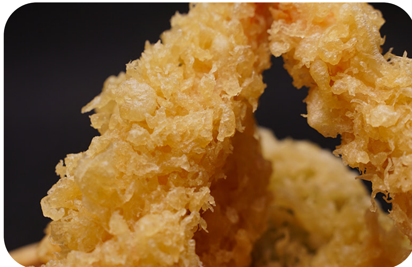
045 Tempura mix tempura di gamberoni* e verdure € 10.00 🌿 🌱