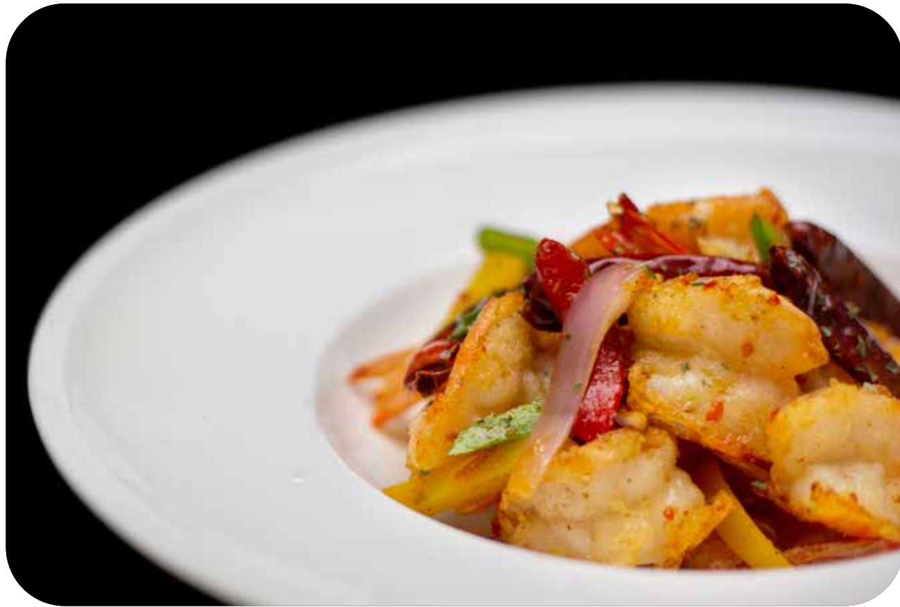
102 Ebi sale pepe gamberi* fritti al sale pepe e peperoncini € 8.00 🌱🌿🌱