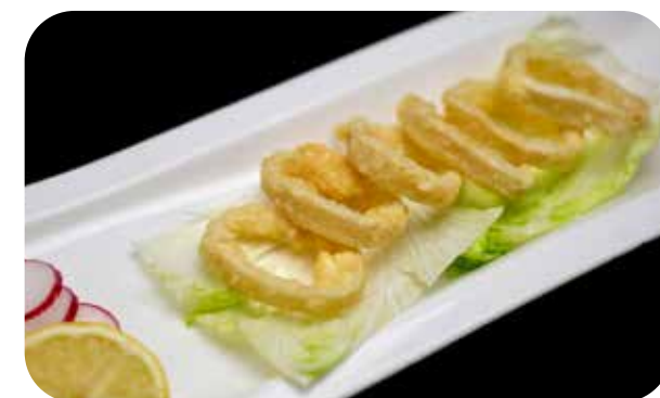
047 Ika no calamari* fritti € 8.00 🌿 🍷