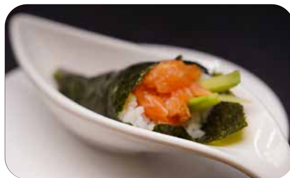
222 Cono spicy salmon salmone tritato, cetriolo, tobiko, tabasco ed erba cipollina € 5.00 🍴 🥑