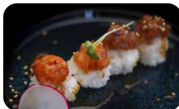
167 Rainbow mix