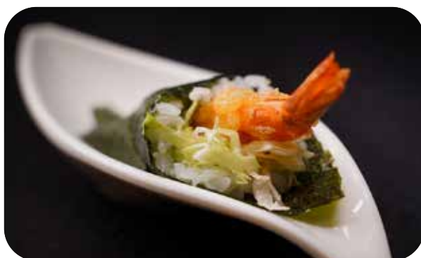
219 Cono ebiten gambero* in tempura, insalata e maionese € 5.00 🍴 🥗 🥑