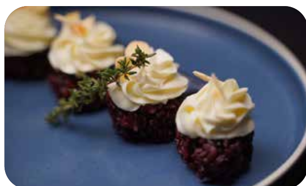
162 Special balls