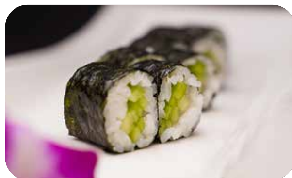
196 Kappa maki cetriolo € 4.00