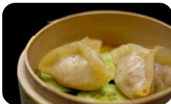
038 Niku gyosa ravioli di carne* € 5.00 🌿