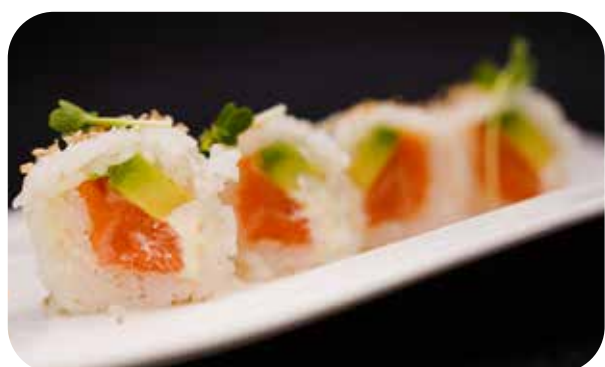
275 U.Light salmon salmone,avocado,philadelphia e sesamo € 8.00 🍣 🍷 🌿 🐟