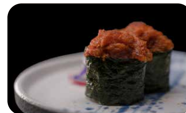
176 G.Spicy tuna

tonno tritato, cetriolo, tobiko, tabasco e alga all'esterno