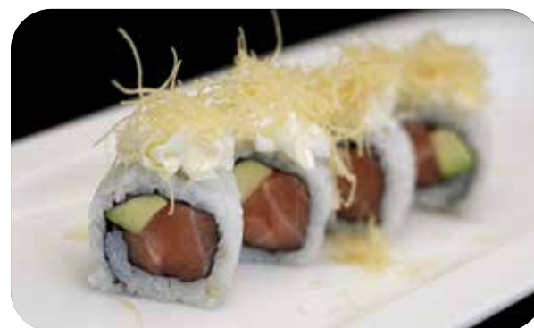
263 U.Sake kataifi [salmone, avocado] philadelphia, pasta kataifi e salsa € 9.00 🍷 🍷 🍱