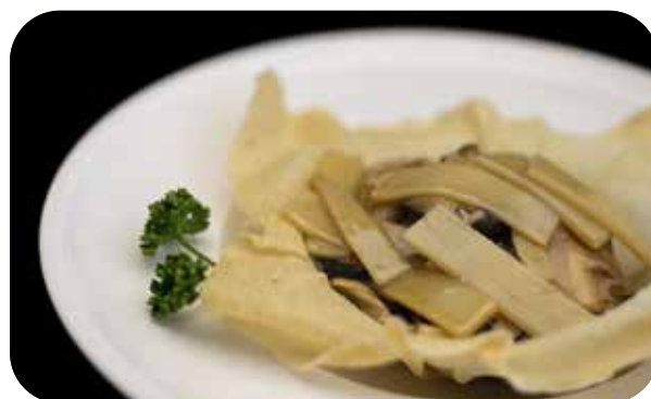
088 Bambu e funghi saltati € 5.00