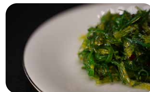
020 Gome wagame alghe marinate € 5.00 🌿