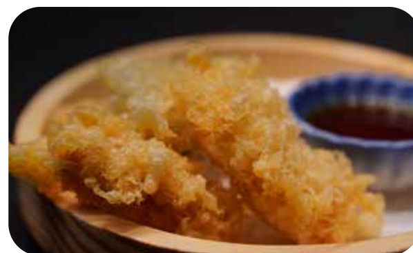
046 Tempura yasai tempura di verdure € 7.00 🌿