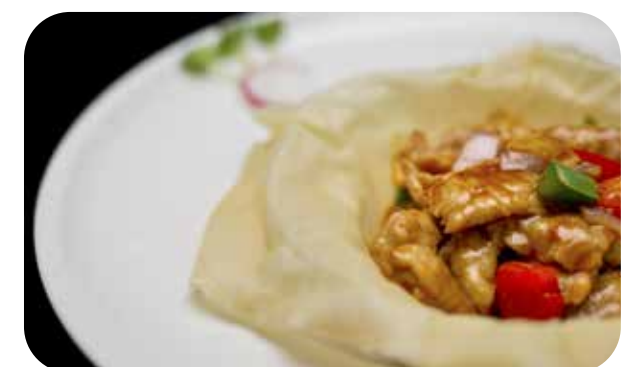
100 Manzo* con salsa piccante € 8.00