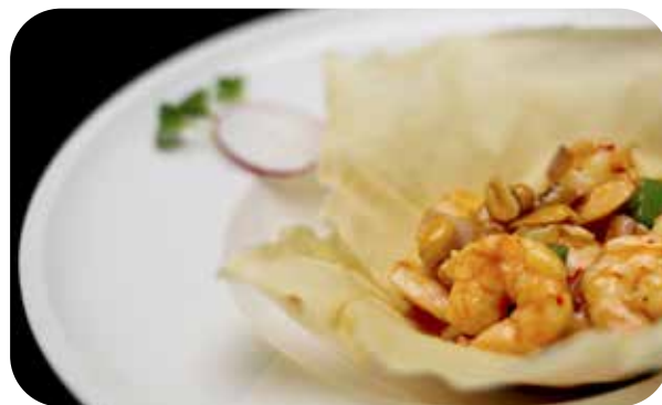
090 Gamberi* con salsa piccante € 7.00 🌱