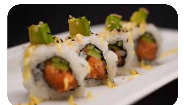
231 U. Spicy salmon [salmone tritato, cetriolo, tobiko, tabasco] avocado, spicy mayo e sesamo € 10.00 🍴 🥗 🥑