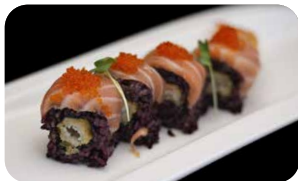
268 U.Noir tiger [gambero* in tempura,maionese] salmone,uova di pesce ed erbe € 12.00 🍣 🍷 🌿 🐟