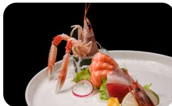
292 Sashimi mix 5 fette di pesce misto € 12.00 🍣 🍷 🐟