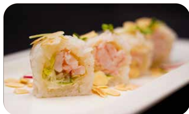
276 U.Light ebi [gambero* cotto,philadelphia, insalata]mandorle ed erbe € 8.00 🍣 🍷 🌿 🐟