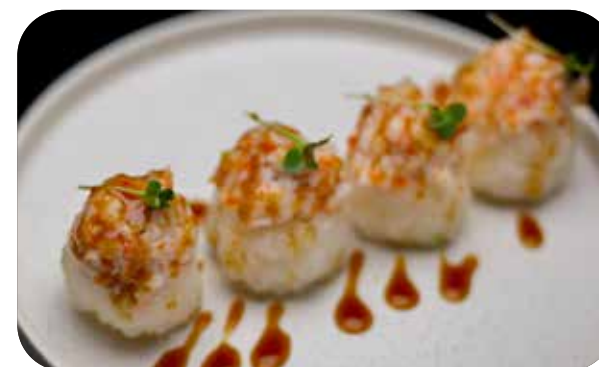
170 California balls

gambero* e surimi* di granchio tritato, tobiko e maionese