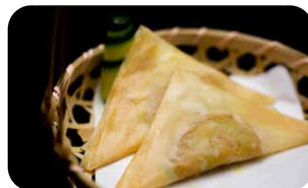
012 Kare gyoza ravioli fritti con pollo*, verdure e curry € 5.00 🌾