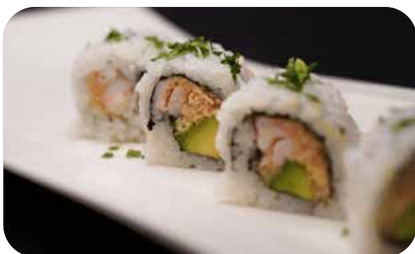
245 U.Tuna paradise [tonno cotto, gambero* cotto, avocado] prezzemolo tritato € 11.00 🍷 🐟