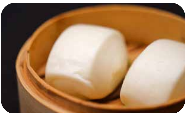
039 Mantou pane cinese al vapore € 4.00 🌿 🥛