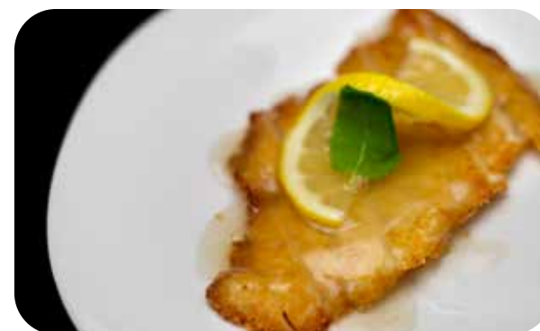
096 Pollo* al limone € 7.00 🌱