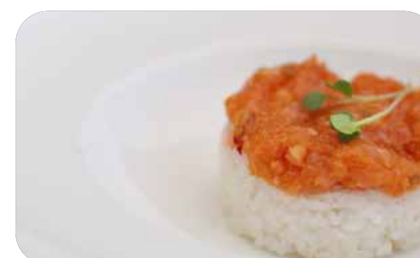
214 Chirashi spicy salmon salmone,cetriolo,tobasco con riso € 10.00 🍷 🥛