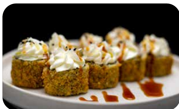
198 Hot phila salmone,phialadelphia e salsa € 7.00 🐟 🥛 🌿