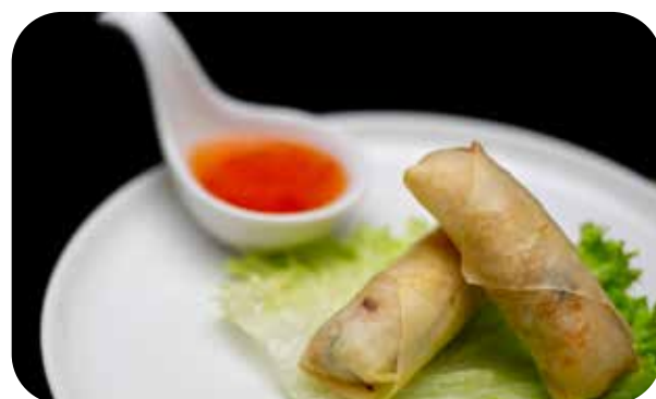
005 Thai maki involtino fritto ripieno di glass noodles, gamberi*, citronella, black fungus, germogli di soia € 6.00 🌾 🍷 🌿