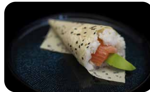
224 Cono light sake salmone, avocado e philadelphia € 5.00 🍴 🥗 🥑