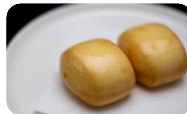
013 Mantou fry pane cinese fritto con salsa milk € 5.00 🌾 🍷