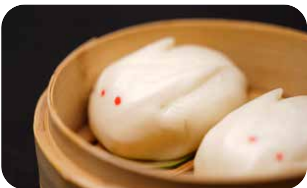
040 Rabby mushi pane cinese ripieno di milk cream € 5.00 🌿 🥛 🥚