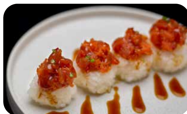
163 Sake balls

salmone tritato, cetriolo, tobiko, tabasco ed erba cipollina