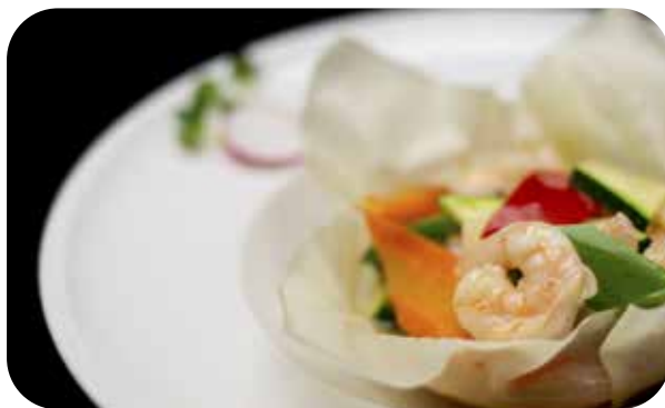
089 Ebi karafuru gamberi* saltati con verdure € 7.00 🌱