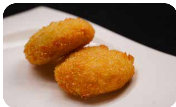
004 Koruke crochette composte da patate, riso, carne* affumicata, carota e creme cheese € 6.00 🌾 🍷