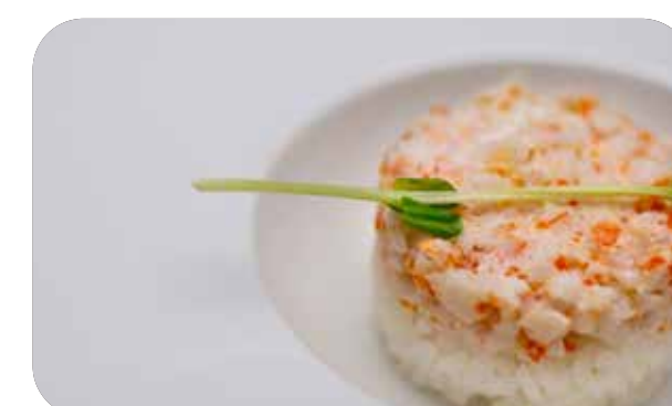
210 Chirashi carifonia gambero*,surimi* di granchio tritato, maionese,tobiko con riso € 8.00 🍷 🥛 🌿