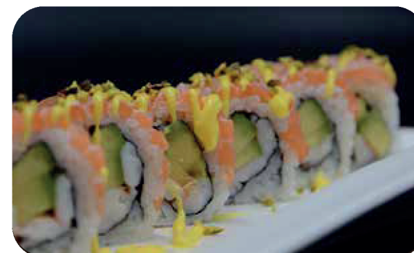
262 U.Salmon paradise [avocado ,gambero*] salmone, salsa zafferano, scaglie di pistacchio € 12.00 🍷 🐟 🍱