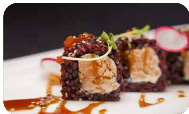
271 U.Noir salmon [salmone cotto,philadelphia] uova di pesce,sesamo, erbe e salsa € 10.00 🍣 🍷 🌿 🐟