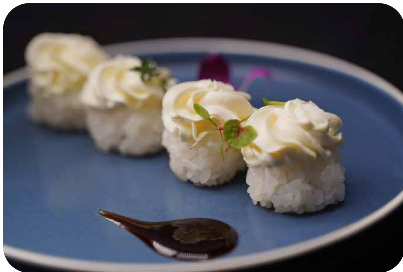
161 Snow balls