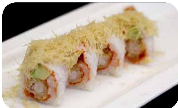
279 U.Light ebiten [gambero* in tempura,maionese, avocado]salsa e pasta kataiffi € 9.00 🍣 🍷 🌿 🐟