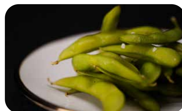
016 Edamame fagiolini di soia € 5.00 🌿