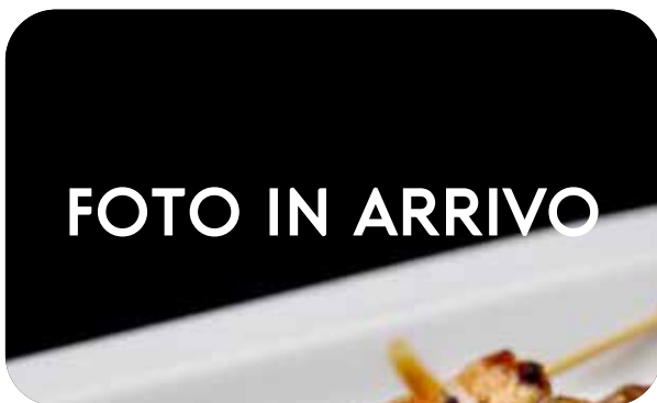
109 Ebi kushi spiedini di gamberi con salsa e sesamo € 8.00 🌱 🌿