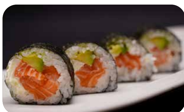
203 Futomaki sake salmone avocado,phialadelphia avvolti in alga nori € 5.00 🐟 🥛