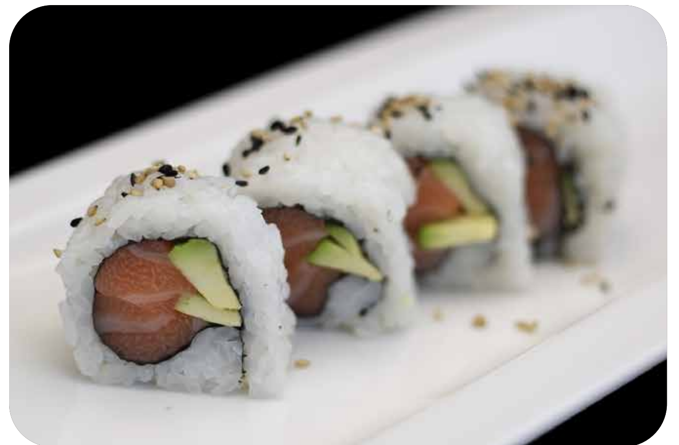
229 U.Salmon avocado salmone, avocado, philadelphia € 8.00 🍴 🥗 🥑