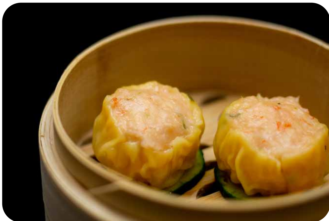
037 Ebi gyosa ravioli di gamberi* € 7.00 🌿 🌱