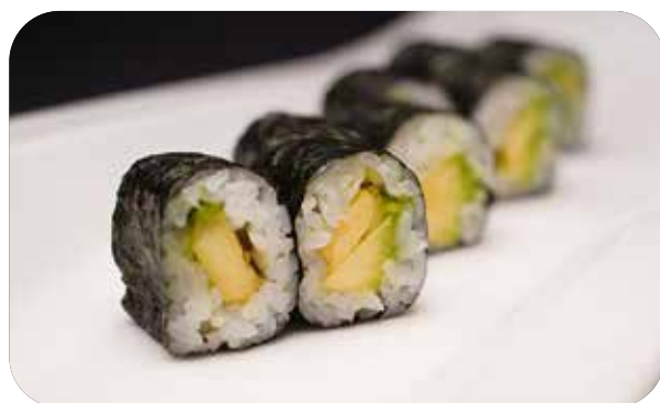
195 Avocado maki avocado € 4.00