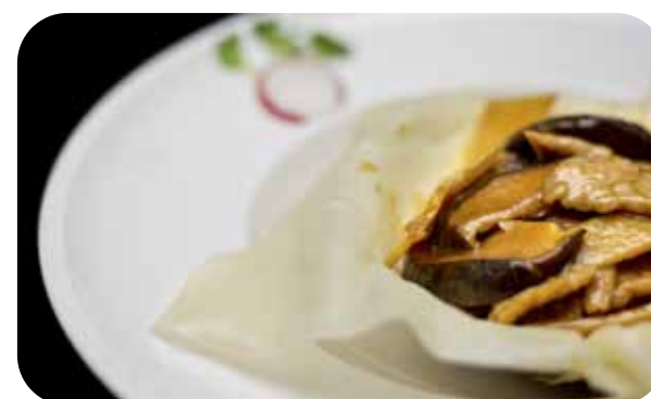
099 Manzo* con funghi bambu € 8.00