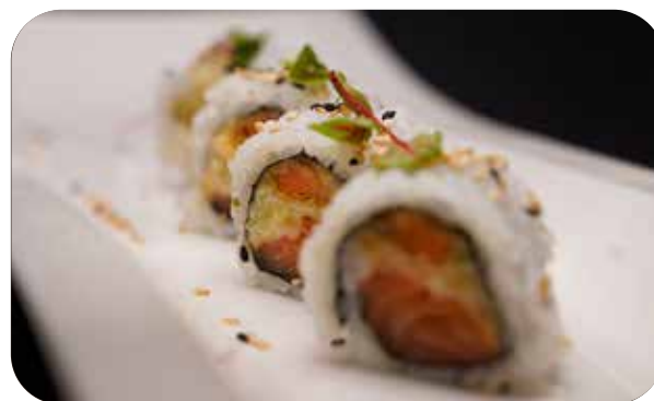
234 U.Yasai salmon [salmone, stick di verdure fritte, salsa tuna] sesamo € 8.00 🐟 🥒 🍱