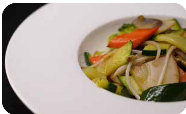
087 Yasai in work verdure saltate in work € 5.00