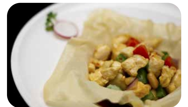
095 Pollo* con salsa piccante € 7.00