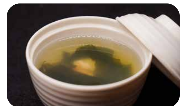
119 Osu mashi zuppa con gamberi*, vongole, naruto e alghe wakame € 5.00 🌱