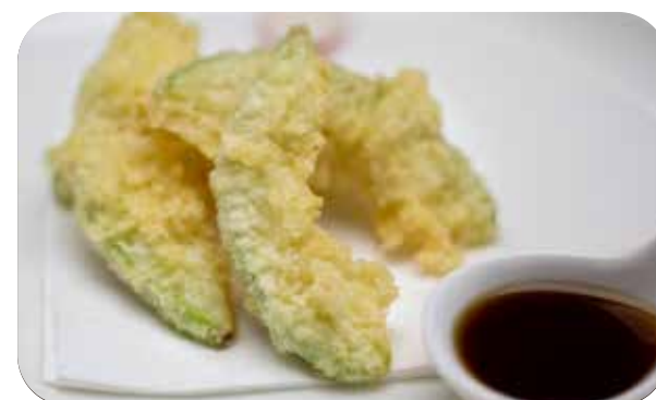
052 Nuvolette di drago nuvolette di gamberi* € 4.00 🌾 🍷 🌿