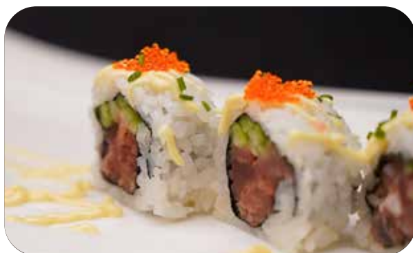
232 U.Spicy tuna [tonno tritato, cetriolo, tobiko, tabasco] uova di pesce e spicy mayo € 12.00 🐟 🥒 🍱