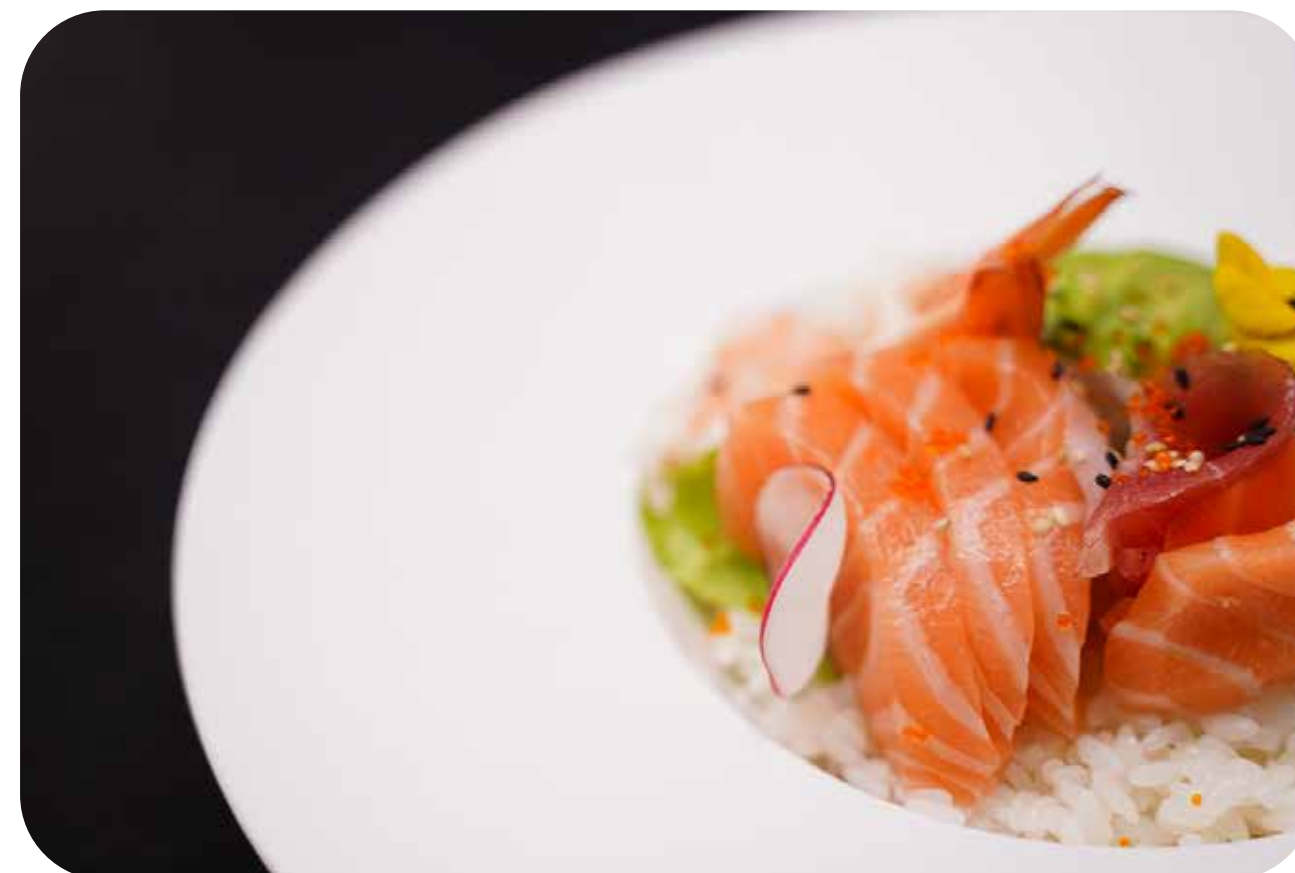
209 Chirashi mix tonno,salmone,gambero*,branzino, avocado con riso € 10.00 🐟 🍷