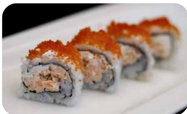
240 U.Salmon rolls [salmone cotto, philadelphia] tobiko e salsa € 10.00 🐟 🍷 🍱