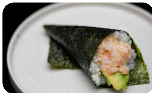
220 Cono california gambero* e surimi* di granchio tritato, tobiko e maionese, cetriolo, avocado € 4.00 🍴 🥗 🥑