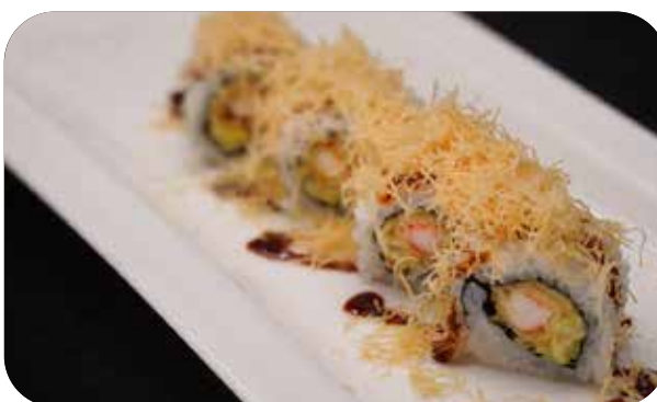
236 U.Ebiten [gambero* in tempura, insalata, maionese] salsa e pasta kataifi € 9.00 🍷 🍷 🍱