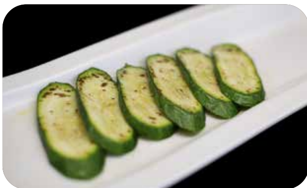
114 Yasai yaki zucchine alla griglia € 5.00