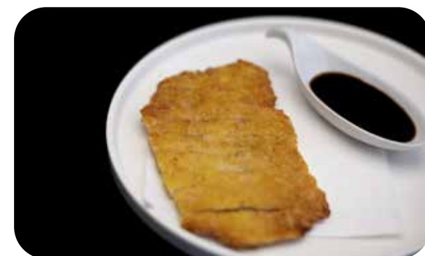
050 Tonkatsu cotoletta di maiale* € 6.00 🌿