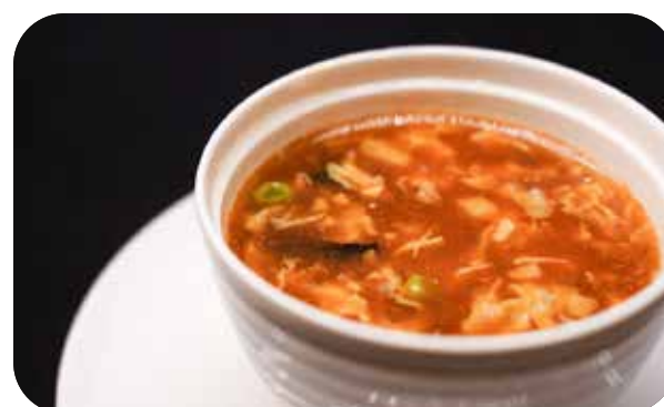
118 Zuppa agropiccante € 4.00 🌱 🌿