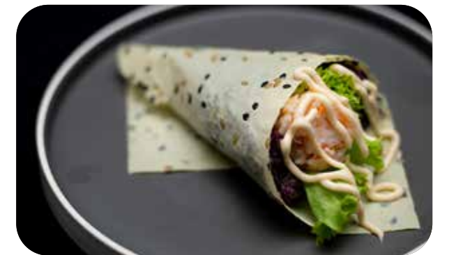
228 Cono black sesame gambero* e surimi* di granchio tritato, insalata e salsa cocktail € 5.00 🍴 🥗 🥑